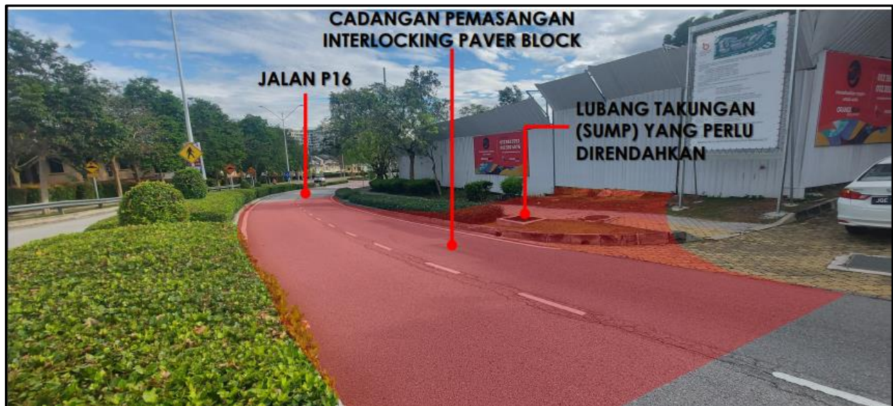
Contoh 1: Gambar kawasan kerja terlibat yang jelas ditanda beserta asset inventori yang terlibat